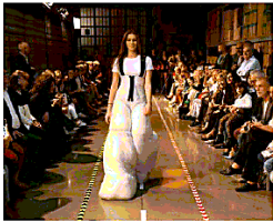
La sfilata di Zani Work

E 150 in tandem con La Stampa. Spedizione in a.p. - d.l. 353/03 (Conv. in L. 27/02/04) Art. 1 Comma 1 - DCB Forlì. Redazione e Pubblicità: Corso della Repubblica, 186, Forlì Tel: 0543-35520; Fax: 0543-35470 - Via Chiaramonti, 34, Cesena Tel: 0547-611900; Fax: 0547-610350. Rimini (0541-354111), Ravenna (0544-218262), Imola (0542-28780) - E-mail: forli@corriereromagnait cesena@corriereromagnait