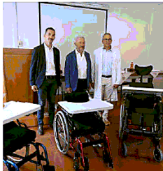
La consegna degli ausili sanitari